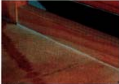
WP Formülasyonu uygulanan bir yüzeyde gözle görülür insektisit kalıntıları